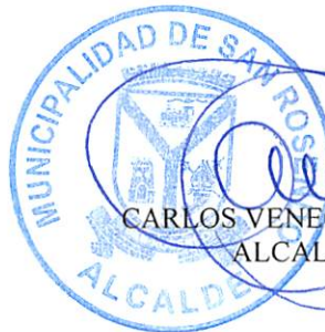
CARLOS VENEGAS LAVADOS ALCALDE(S)