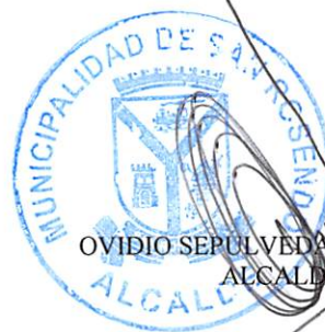
OVIDIO SEPULVEDA SAN MARTIN ALCALDE